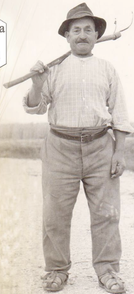
Museo della Civiltà Contadina - Fraz. Cipolleteo - Gubbio